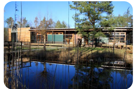
Informationszentrum Auenhaus

spannten Abend unter freiem Himmel im Biosphärenreservat Mittel- elbe. Das Auenhaus ist an diesem Tag von 11 Uhr bis Veranstaltungsbeginn geöffnet. Der Eintritt in die Ausstellung und zur Veranstaltung ist kostenfrei. Ort: Informationszentrum Auenhaus, Am Kapenschlösschen 3, 06785 Oranienbaum