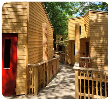
Wohnen in den Bäumen