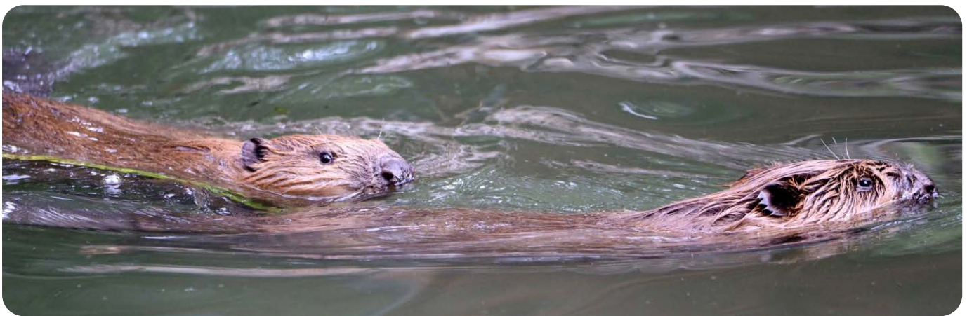
Elbebiber im kühlen Nass im Süden des Biosphärenreservates

Folgender Partner ist nicht mehr im Partner-Netzwerk dabei: Coffeecruiser Body & Mind, 39114 Magdeburg (Sachsen-Anhalt) Für die bisherige Zusammenarbeit bedanken sich die Biosphärenreservatsverwaltungen sehr!