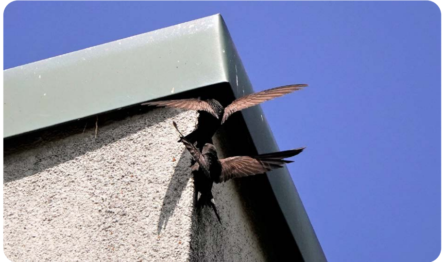
Mauersegler in Boizenburg

Das Zwitschern der Schwalben auf dem Land und die markanten Rufe der Mauersegler in den Städten sind unverkennbar ein Zeichen, dass der Sommer da ist. Doch sowohl Mehl- als auch Rauchschnalben gelten als gefährdet und auch Mauersegler haben mit dem Verlust von Nistmöglichkeiten zu kämpfen. Um diesen Entwicklungen etwas entgegen zu setzen, unterstützt der Förderverein Biosphäre Elbe MV e.V. aktuell wieder die Partnerinnen und Partner des Biosphärenreservates, Privatpersonen und die Biosphären-Gemeinden bei der Beschaffung von Nisthilfen. Die Anbringung von Nisthilfen bietet sich insbesondere dort an, wo bereits Schwalben oder Mauersegler nisten, da es sich bei allen drei Arten um Koloniebrüter handelt. Für Mauersegler und Mehlschnalben sollten die Nisthilfen an der Außenwand,