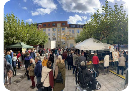
Veranstaltungen in der Biosphärenreservatsregion

(Vorteil: für Partner, die nur wenige Veranstaltungen haben / Nachteil: die Veranstaltungen können nicht nachträglich geändert oder bearbeitet werden)