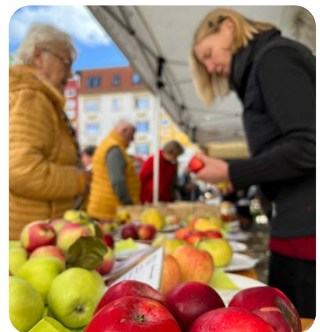
Impression vom Apfelmarkt Wittenberge